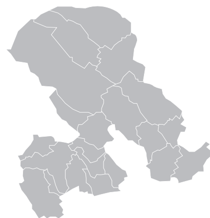
Carte des Jeunesses de l'Aubonne.

Après cinq jours de festivités, le dimanche est le point culminant du Giron. La partie officielle qui suit le banquet est l'occasion de rendre hommage aux organisateurs dans une ambiance festive. Une fois la partie officielle et le banquet consommé, un défilé de chars traverse le village en signe de gratitude envers les villageois pour leur soutien. Cette dernière parade permet à chacun de dire au revoir et clôturer les festivités en beauté.